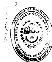
Coord. De carrera