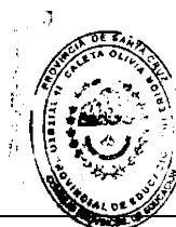
COORDINADORA/A DE CARRERA